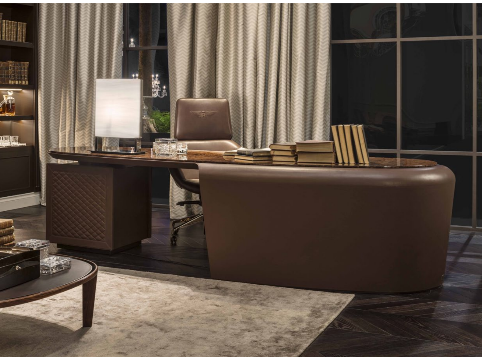
Bierko President oraz dedykowane do niego krzesło Elle cieszyły się ogromnym zainteresowaniem na targach w Paryżu