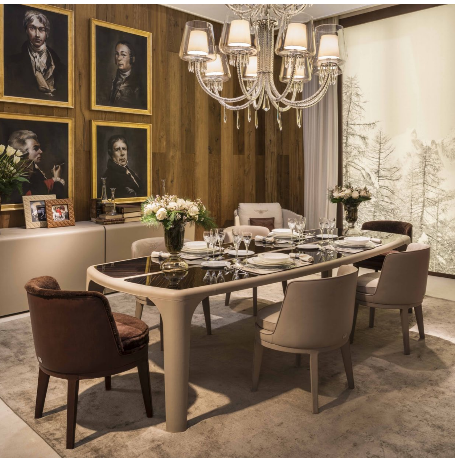
Kwintesencja stylu Bentleya – naturalne barwy, połączenie skóry i drewna oraz ponadczasowy design

KOLEKCJA BENTLEY HOME TWORZY LUKSUS W MIESZKANIU I BIURZE. ŁĄCZY CECHY CHARAKTERYSTYCZNE DLA WSZYSTKICH MODELI BENTLEYA - RZEMIOSŁO, TRADYCJĘ, DZIEDZICTWO, WYRAFINOWANE PROJEKTY I EKSKLUZYWNY ANGIELSKI STYL.