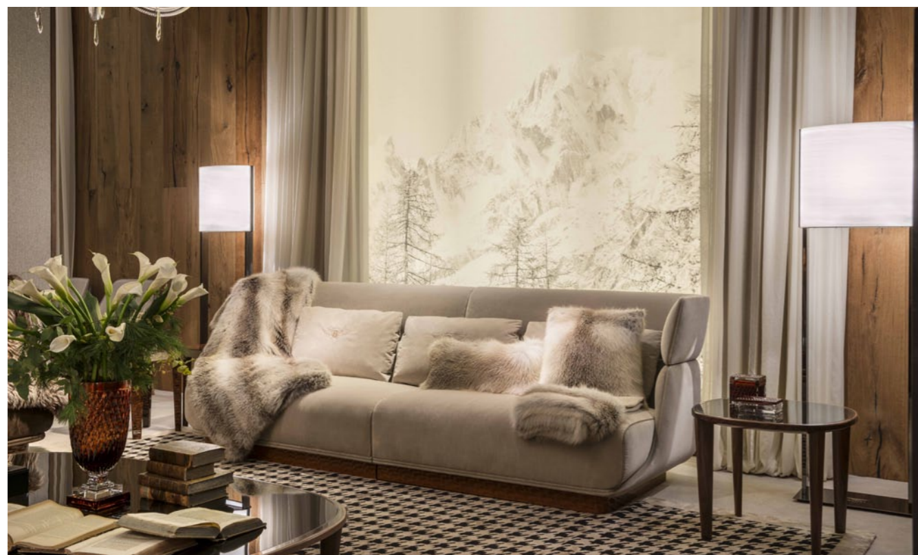
Sofę Lancaster w takim wykończeniu możemy obejrzeć w warszawskim salonie

Wprowadzenie na rynek tak ekskluzywnych marek jak Bentley Home oraz – również dostępnej w warszawskim salonie – marki Fendi Casa to sukces Warszawy. Showroom otwarty w budynku Metropolitan przy placu Piłsudskiego swoim poziomem dorównuje najbardziej ekskluzywnym salonom na świecie. Dzięki niemu nie musimy wyjeżdżać z Polski, by zetknąć się z luksusem na najwyższym światowym poziomie. Stolica Polski dołączyła do bardzo nielicznej i prestiżowej grupy miast, które mogą się poszczycić takim miejscem. III